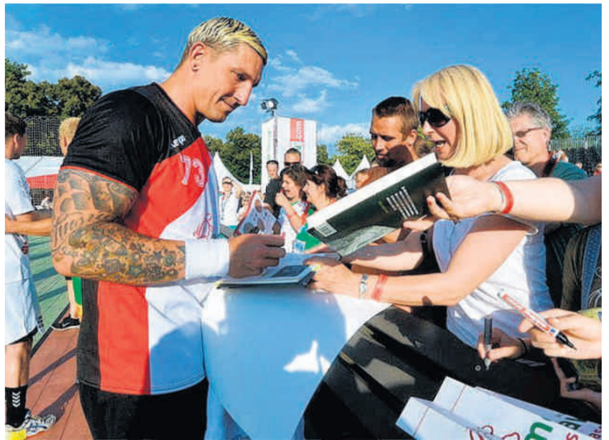
Stefan Kretzschmar ist auch in diesem Jahr wieder mit von der Partie.

Tageskarten und Kombi-Tickets sind unter 03473/ 8 40 94 40 erhältlich.